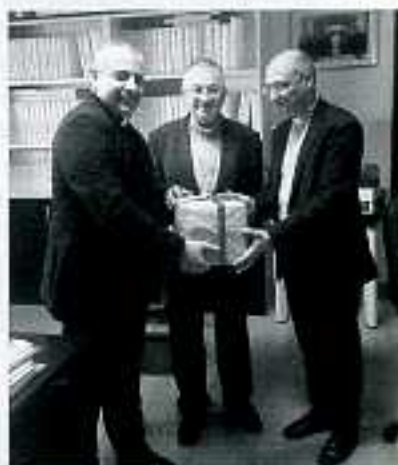
Consegna del plico contenente i documenti dell'inchiesta diocesana alla Congregazione delle Cause dei Santi.